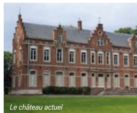
Le château actuel