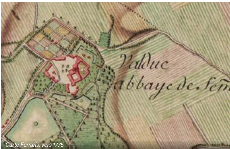
Carte Ferraris, vers 1775