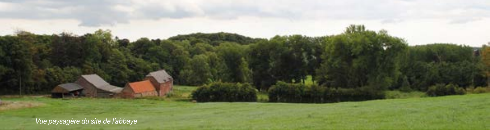
Vue paysagère du site de l'abbaye

La commune de Beauvechain bénéficie d'un emplacement idéal, à proximité de la ville de Louvain, au cœur d'un terroir riche en limon, particulièrement fertile et partagé âprement entre le duché de Brabant et la principauté de Liège. Pas étonnant donc d'y compter un ancien monastère qui a joui d'une belle réputation et d'un rayonnement non négligeable, une abbaye de femmes connue sous le nom d'abbaye de Valduc. Ce très bref historique du domaine s'inspire largement de l'ouvrage de Jacques Lavalleye : Histoire de l'abbaye de Valduc. Il s'agit d'une plaquette rédigée en 1926 à la suite du dépouillement des archives de l'abbaye, opéré dans le cadre de la thèse doctorale qu'il a soutenue à l'UCL. Les sources archivistiques qui peuvent éclairer l'histoire de cette congrégation sont peu nombreuses. Les rares documents conservés sont des pièces comptables, quelques heureuses vues d'artistes ainsi qu'un petit document de première main qui remonte au 15 e siècle et qui narre l'histoire de la communauté, la chronique de Valduc.