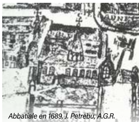
Abbatiale en 1689

d'avoir un excédant constant qui va assainir et asseoir les revenus du monastère. Le redressement économique est considérable. Elle fera d'ailleurs appel, en 1765, à Laurent Benoit Dewez (1731-1812) pour réédifier le monastère dans le style classique. C'est à cet architecte célèbre que l'on doit également la reconstruction de l'abbaye d'Orval et à la transformation de celles d'Heylissem, Affligem, Floreffe, Ninove, Gembloux. Il est aussi l'auteur du château de Seneffe. Les finances de Valduc attirent la convoitise, c'est pourquoi le gouverneur impose au monastère de participer financièrement à la construction de la chaussée de Louvain, en 1757, et de céder des terres à Nodebaïs et Hamme en vue de permettre son tracé.