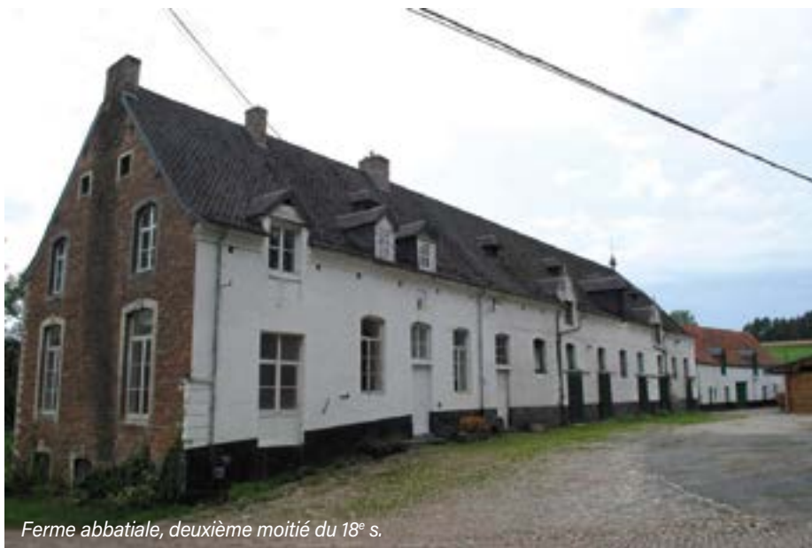
Ferme abbatiale, deuxième moitié du 18 e s.

de plusieurs refuges (Bruxelles, Grez et Louvain) ainsi que la réparation de granges (fermes) à Hèze et à Mille. La reconstruction du chevet de l'église, dans le goût du temps, y est signalée en 1414 et l'édification du moulin en 1431. Cette restauration a été possible grâce à ses nombreuses richesses matérialisées pour l'essentiel par le rendement de ses terres cultivables, la perception de la dîme et la vente très lucrative des céréales.