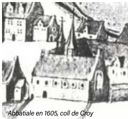
Abbatiale en 1605, coll de Croy

Le 18 e siècle laisse place une période de paix qui favorise l'enrichissement des institutions. C'est en 1730 que Thérèse Fiocco prend les rênes de Valduc et ce pour 38 ans. Le domaine est beaucoup plus restreint mais sa gestion rigoureuse permet